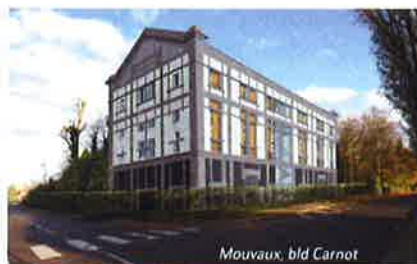
Mouvaux, bld Carnot

Habitat du Nord, c'est l'union de la SA d'HLM Habitat du Nord et d'Habitat du Nord Coop. Leur mission commune est de proposer un logement abordable et de qualité aux ménages à revenus modestes. Pour y parvenir, la première se spécialise dans la location et la seconde dans l'accession à la propriété.